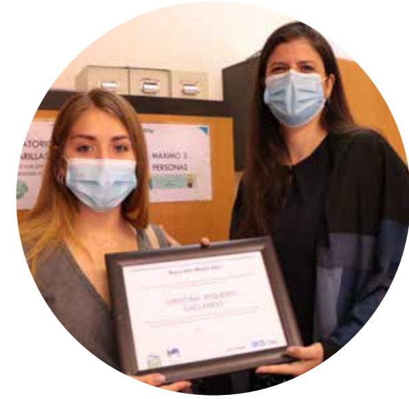
Becas Alto Maipo