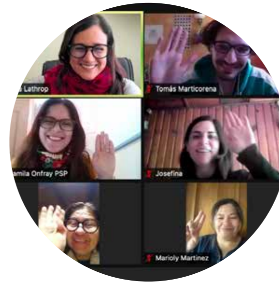
Fondo Concursable San José de Maipo