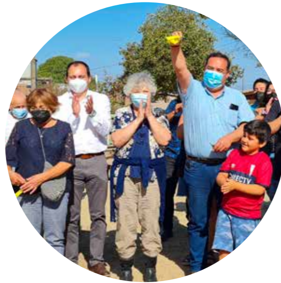
Fondo Concursable Puchuncaví