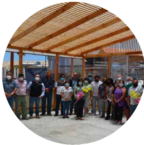
Fondo Concursable Huasco

Durante 2021, tuvimos tres casas-oficinas abiertas a la comunidad; en Huasco, Puchuncaví y San José de Maipo, en la medida que los grados de movilidad de la pandemia lo permitieron.