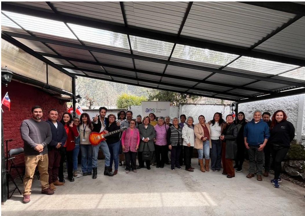
Fondo Concursable San José de Maipo 12° versión: Proyecto “patio techado” Junta de vecinos El Esfuerzo